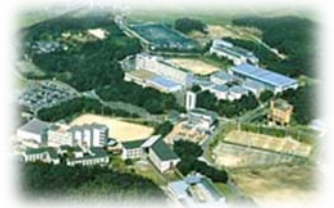
美浜キャンパス全景

日本福祉大学 美浜キャンパスでは7月17日(土)に夏のオープンキャンパスを開催いたします。それに伴い、富山オフィスではバスツアーを企画いたしました。進路決定のご参考や、あるいは本学への志望意欲の向上に繋がれば幸いです。ご家族やお友達と一緒に参加してみませんか?