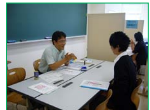
教員による相談コーナー